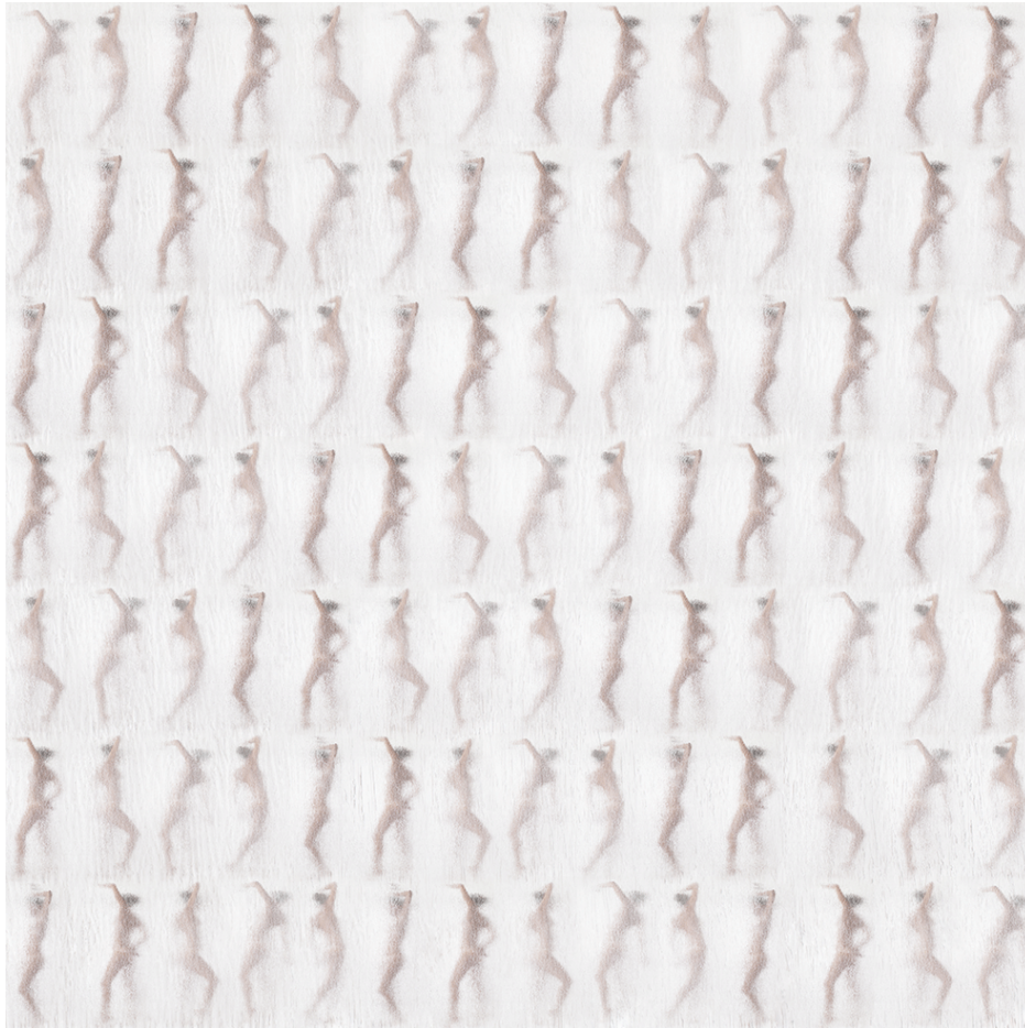
DNA Dance, 2022 Lenticular photography 50 x 50 cm Ed 2/2 + 2 AP