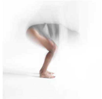
Satis I, II et III, 2020 C-print on cotton paper, framed 20 x 20 cm