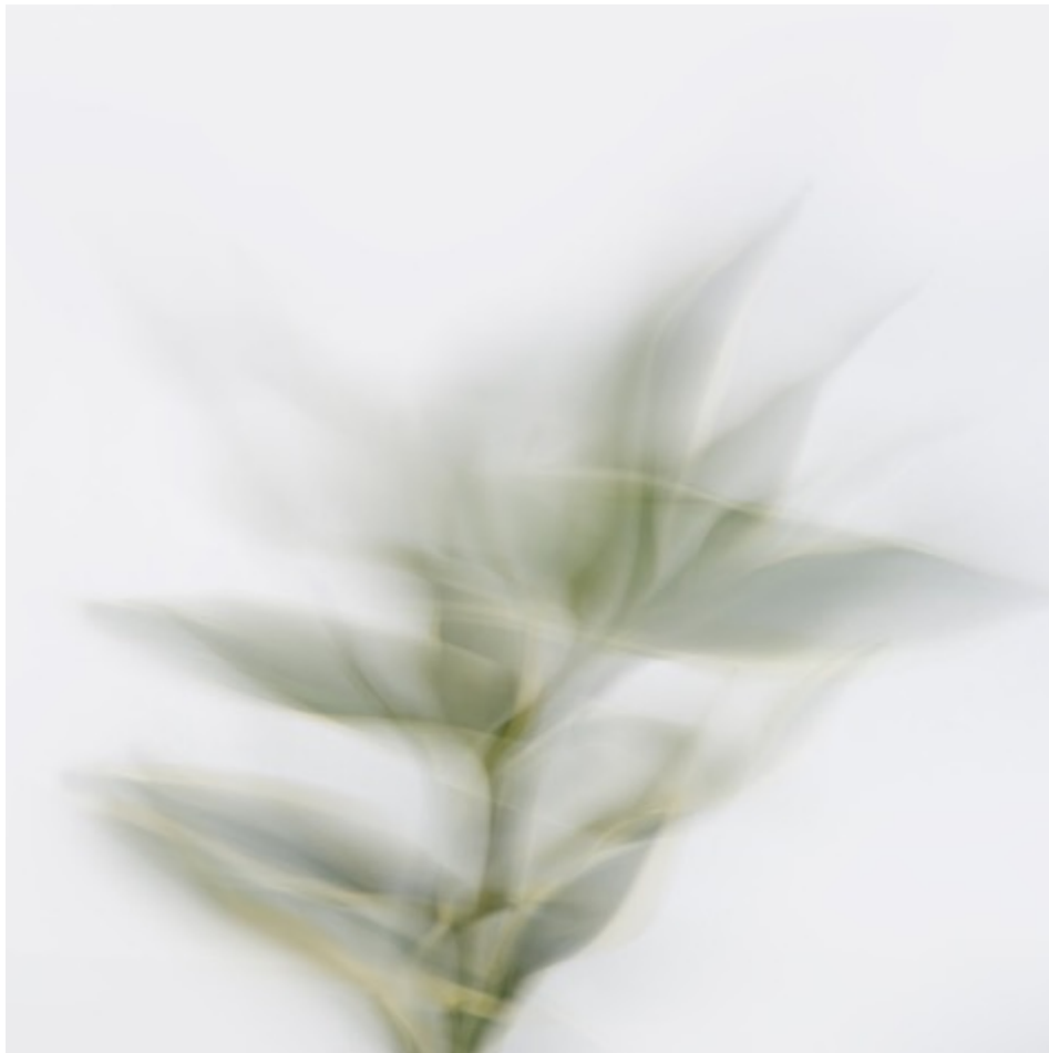
Hostas , 2022 Lenticular photography 100 x 100cm Ed 1/5 + 2 EA