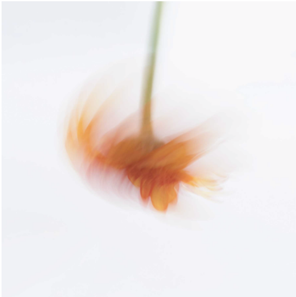
Gerbera Rubrum II , 2018 C-print on cotton paper 30 x 40 cm Ed 1/3