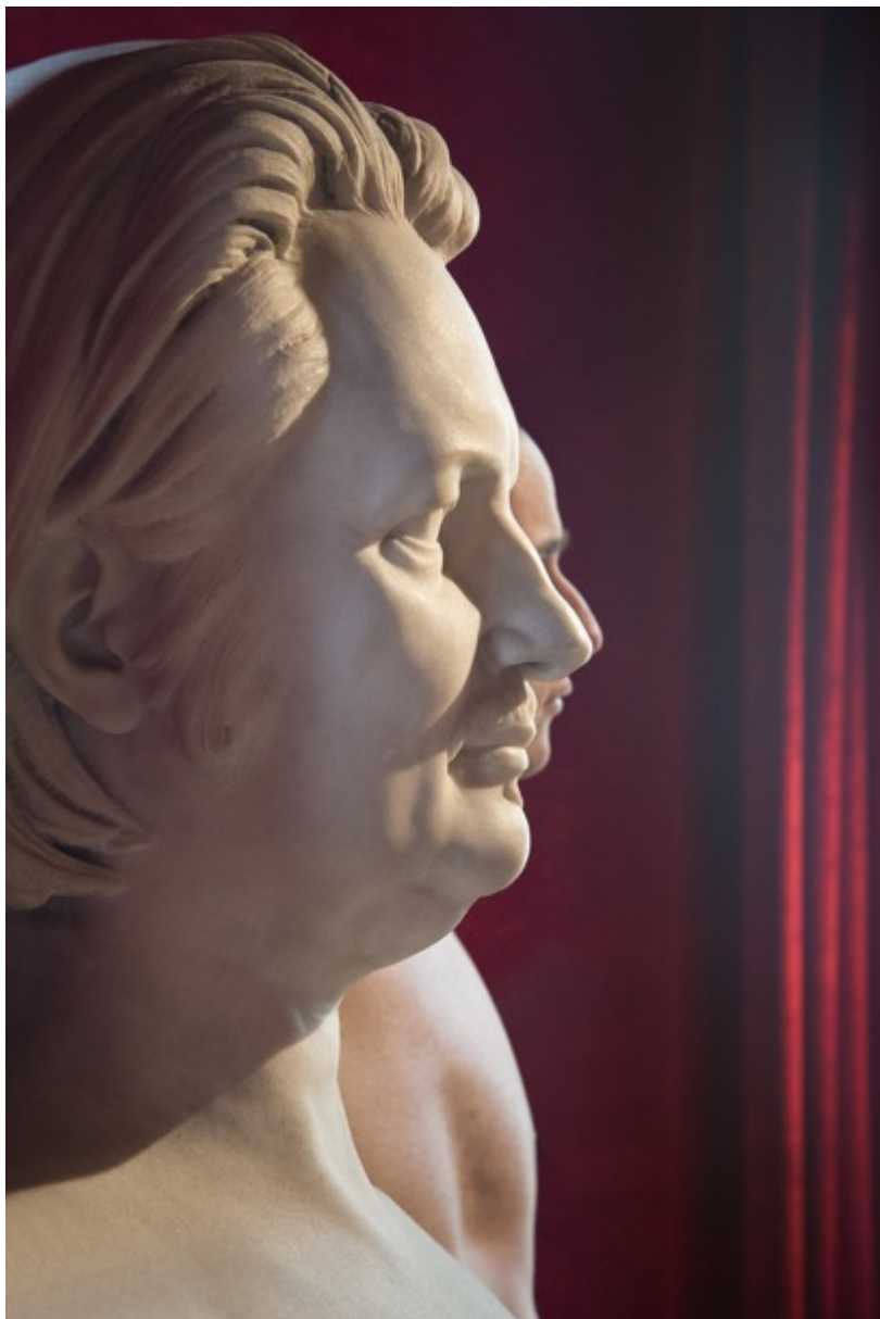
Portrait d'Honoré de Balzac en marbre de Pierre-Jean David dit David d'Angers (1844)