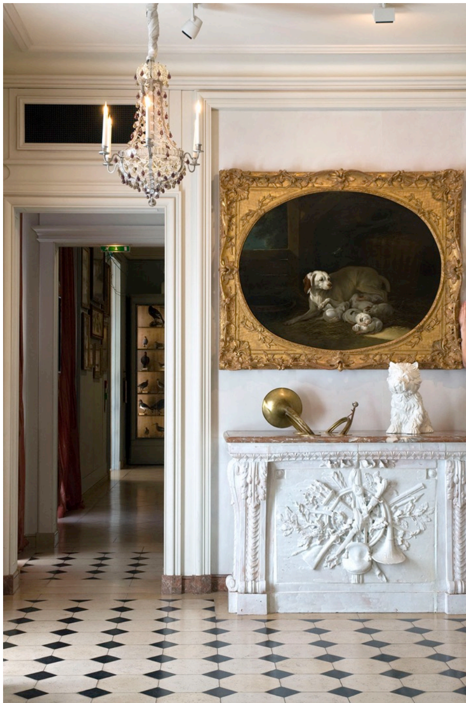
La Lice et ses petits de Jean-Baptiste Oudry (salon de 1753), poêle aux accessoires de chasse en faïence de Strasbourg (deuxième moitié du XVIIIe siècle), Carole, lustre provenant d'un théâtre (XIXe siècle), vase en porcelaine Puppie de Jeff Koons (1998). Musée de la chasse et de la nature, 2012 Tirage argentique monté sur dibon, encadrement en bois blanc, verre 3mm Ed 2/5 70 x 100 cm