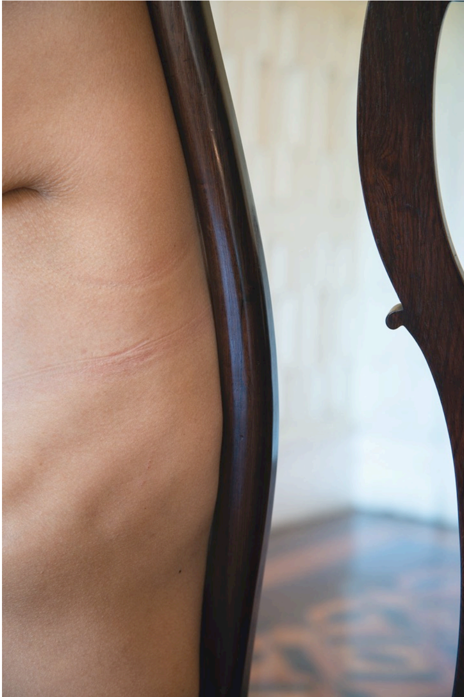
Detail of a wooden chair, Ada. Rio Negro Palace (Petropolis, Brazil), Ibram, Minc, 2015. Tirage argentique monté sur dibon, encadrement en bois blanc, verre musée Ed. 1/5 70x50 cm