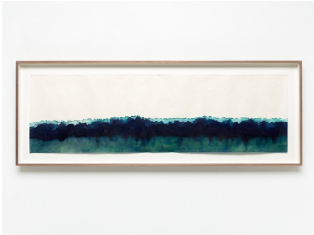
Panorama II , 2021

Papier Japon Tosa Shoji, encre de chine couleur