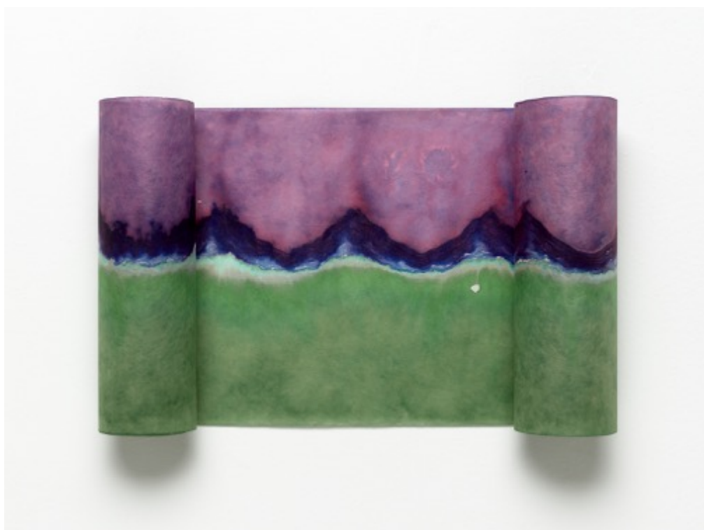
Panorama I, 2021

L'ensemble des recherches et propositions plastiques de Vivianne van Singer s'attache à prendre la couleur là où elle se trouve, et surtout là où, jamais seule, elle touche, atteint le regard, émeut la conscience. Les lieux élus de la couleur sont ainsi : ceux du corps et des fluides qui le traversent, des substances qui le soignent et le nourrissent, éléments chimiques tantôt remèdes, tantôt poisons. Ceux du décor, de la surface et des profondeurs, ceux des objets, des terres et pigments, ceux du paysage et des œuvres d'art. Là où, souvent inaperçue, elle apparaît, intense, magique, mémorable. Cette couleur une fois saisie, attrapée, va être reprise, travaillée, manipulée, étalée, piégée en quelque sorte pour retrouver un sens autre, une densité et une intensité nouvelles. Par des inventions et des stratagèmes, une mise en pratique de ce qui se découvre, s'observe, fascine, surprend, évoque et provoque. Il s'agira de faire entre le voir et le nommer. Prendre et donner du temps à cette pratique ainsi qu'au regard. Des temps qui se suivent ou se donnent comme simultanés. Ainsi les couleurs vont occuper des territoires divers, réels, imaginaires ou encore symboliques. Et ces lieux que la couleur occupe vont donner lieu à des œuvres : images, installations, objets multiples.