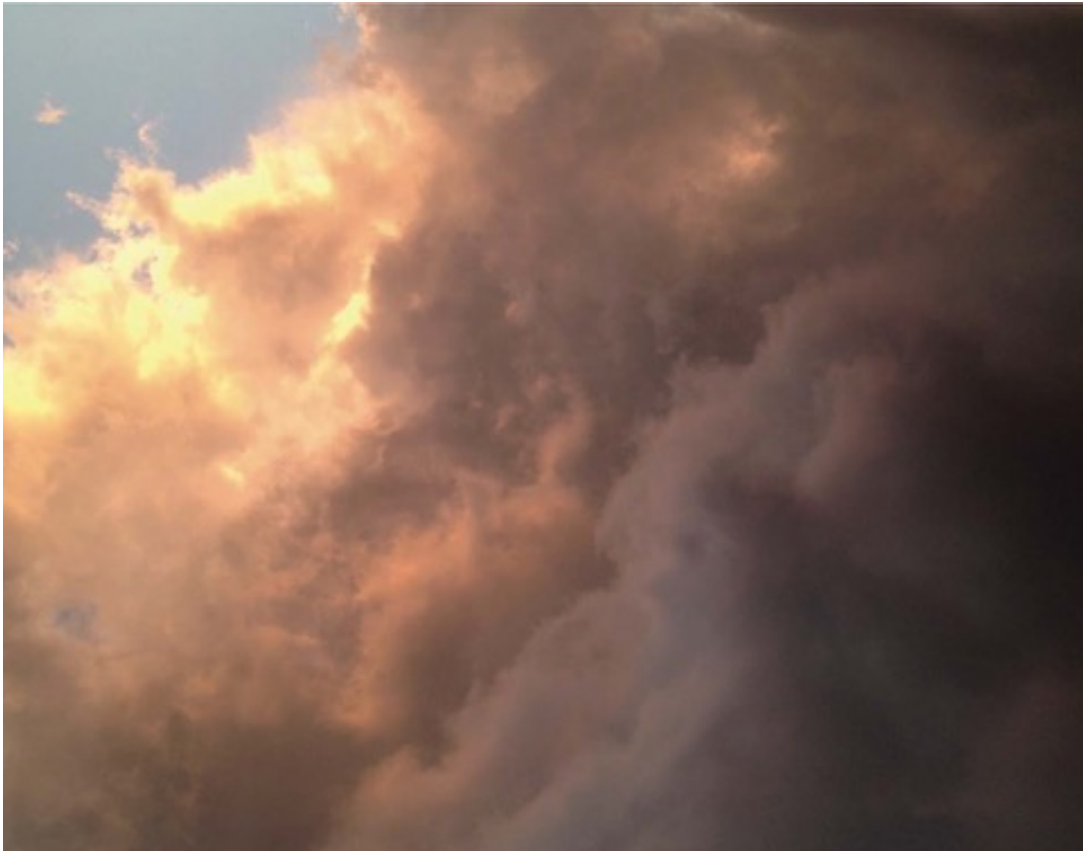
Nuée , 2017 Tirage sur papier Hanemühle 500gr Ed1/3 + 1EA 61 x 76 cm