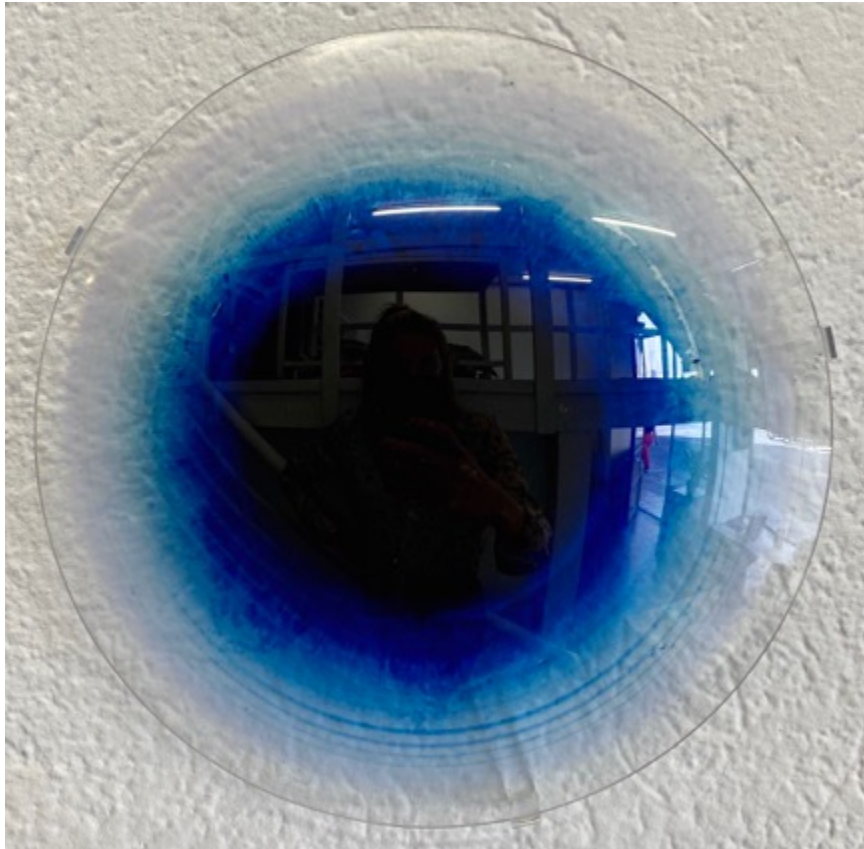
Evaporato , 2018 Verre, encre Dimensions Ø16 cm