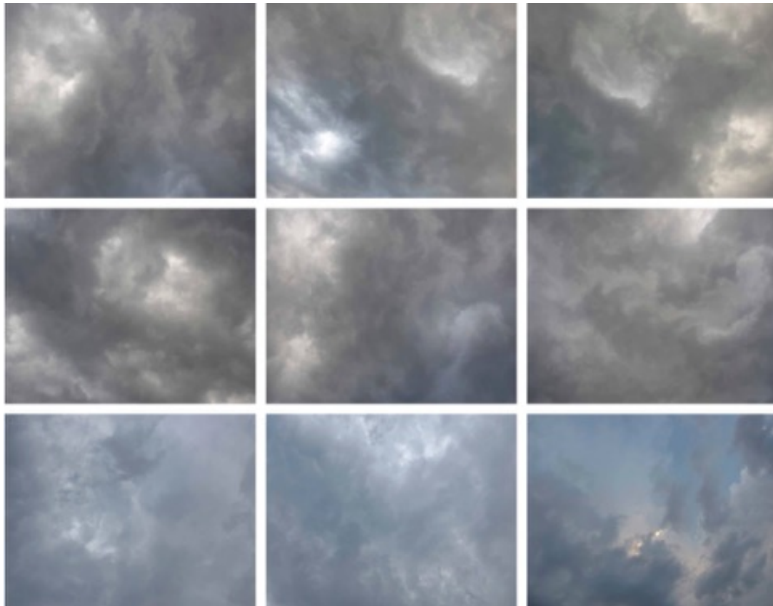
Ciel, variations, 2017 Tirage sur papier Hanemühle 500gr Ed3/3 + 1EA 61 x 76 cm