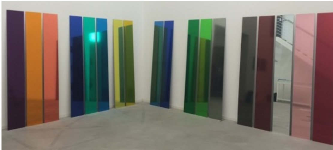
I.M.E.I.M.A. , 2001-2015 18 miroirs rectangulaires, filtres colorés 28 x 198,5 cm